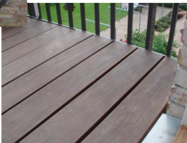
Illustrationsfoto af den relevante type altan fra Altan.dk A/S